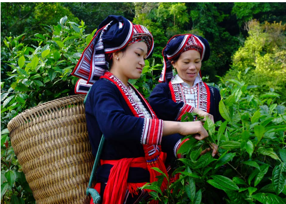
Femmes Dao cueillant du thé Shan dans la province de Ha Giang.

En lui-même, le modèle MARP constitue probablement le plus grand enseignement. Plusieurs de ses composantes ont fait leurs preuves et leur association a permis d'atteindre les résultats escomptés. À l'avenir, le modèle MARP pourrait être optimisé par un soutien encore plus appuyé à la gestion des affaires pour les entreprises des chaînes de valeur et par l'implication d'acheteurs locaux et étrangers comme partenaires de mise en œuvre, afin de parvenir à un développement plus durable des chaînes de valeur. Le recours à un modèle MARP ainsi amélioré pourrait permettre à d'autres ménages pauvres issus des minorités ethniques vietnamiennes de bénéficier d'une augmentation de leur revenu et d'une amélioration de leur qualité de vie.