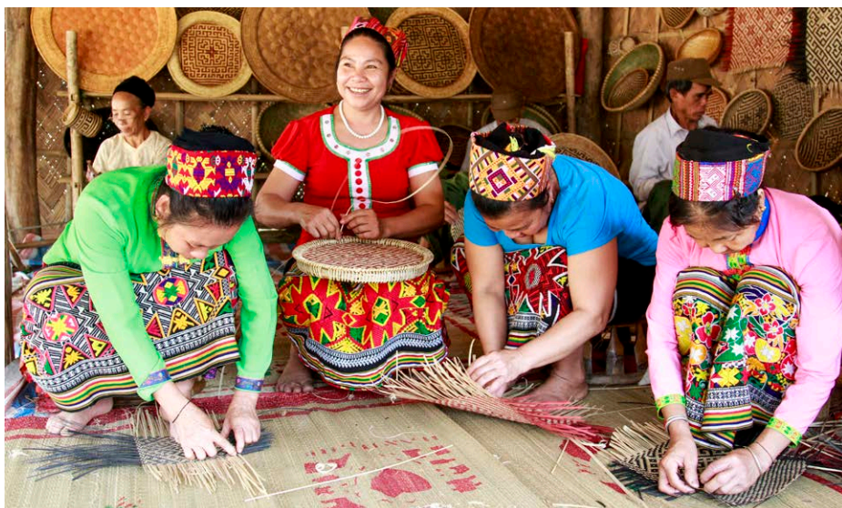
Femmes issues d'une minorité ethnique réalisant des articles en bambou.

Le programme MARP a soutenu quatre projets liés à huit chaînes de valeur dans huit provinces du nord du Vietnam. L'une des organisations chargées de la mise en œuvre, SNV Vietnam, a soutenu le secteur des épices (anis étoilé, cardamome, cannelle). Oxfam a développé les chaînes de valeur du rotin et du bambou. La Vietnam Handicraft Exporters Association (VIETCRAFT) a favorisé la durabilité de chaînes de valeur axées sur des textiles ethniques (chanvre, soie). Enfin, HELVETAS Swiss Intercooperation a soutenu des chaînes de valeur dédiées à du thé de grande qualité (thé Shan) au nord du Vietnam, au Laos et au Myanmar.