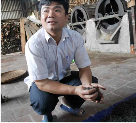
Le gérant de l'usine de thé de Bac Ha devant les machines de séchage des feuilles sponsorisées par le programme.