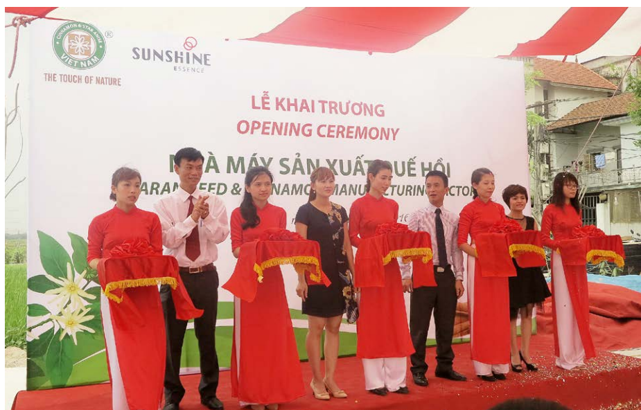
Inauguration de la première usine de transformation d'épices dans le nord du Vietnam, une avancée marquante dans le secteur des épices.

À tous les niveaux, les structures de gestion devaient être légères pour qu'il soit possible d'économiser de l'argent et du temps, de décentraliser la prise de décisions et de consacrer davantage de ressources à l'action concrète qu'au travail administratif. Les tâches administratives ont été partiellement déléguées aux partenaires des chaînes de valeur. La DDC a toutefois conservé la responsabilité du suivi et de l'évaluation du programme, recensant continuellement les progrès accomplis.