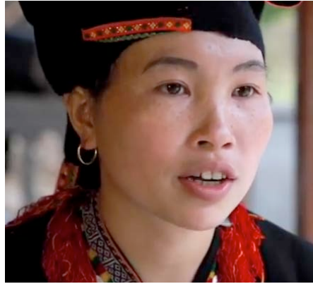
Cultivatrice de cannelle soutenue par le programme dans le nord du Vietnam.

La DDC a calculé que le programme MARP a permis d'augmenter le revenu de 15 512 ménages de 8.9 millions USD au total, soit de 575 USD par ménage sur trois ans. Ces chiffres concernent 62 % de tous les ménages soutenus par le programme (25 095 ménages). Les 38 % restants ont participé au programme pendant moins de deux ans et peuvent escompter une augmentation de revenu après la clôture